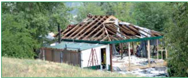
З ПЛЯЖУ «ВЕРБНИЙ» ПРИБРАЛИ СУМНІВНИЙ ШИНОК