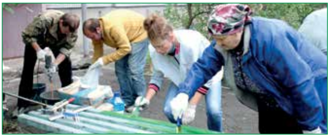
НА ОБОЛОНІ ВІДБУДЕТЬСЯ ОСІННЯ ТОЛОКА