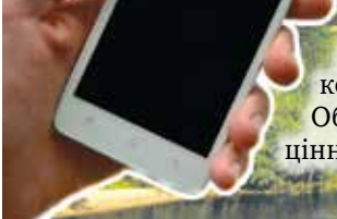
Фото переможців будуть публікуватися протягом вересня в кожному номері «Правозахисту Оболоні». На переможців очікують цінні подарунки.

«Правозахист Оболоні» продовжує конкурс-селфі. Нашому району є чим пишатися: пам'ятками культури, визначними місцями, чудовою природою та неперевершеними краєвидами. Якщо ви любите Оболонь так, як любимо її ми, то пропонуємо взяти участь у нашому конкурс-селфі «Відкрив всім свою Оболонь». Сфотографуйте себе на найкращому, на вашу думку, фоні Оболоні, та надсилайте світлинки на нашу електронну адресу pravooboloni@gmail.com