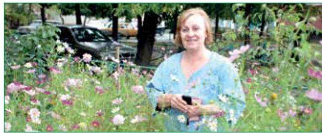
ОБОЛОНЦІ ПЕРЕТВОРИЛИ СВІЙ БУДИНОК НА КВІТУЧИЙ САД