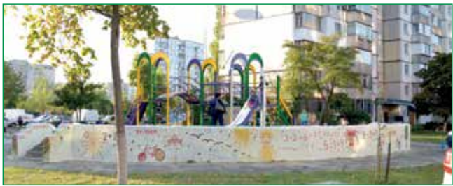
ОБОЛОНЦІ МАСОВО ОНОВЛЮЮТЬ СВОЇ ПОДВІР'Я