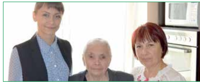
ОБОЛОНЧАНКА ВІДЗНАЧИЛА 90-РІЧНИЙ ЮВІЛЕЙ