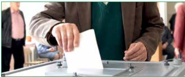
КУДИ ОБОЛОНЦІ ПІДУТЬ ГОЛОСУВАТИ?