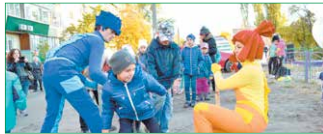
ДИТЯЧЕ СВЯТО – ВСТАНОВЛЕНО НОВИЙ МАЙДАНЧИК