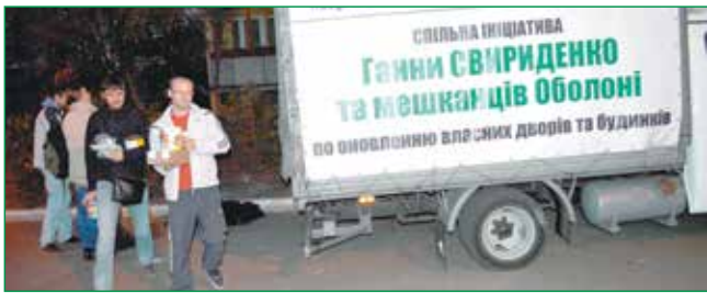
ТОЛОКА СТАНЕ НАЙЯСКРАВИШИМ ЗАХОДОМ НА ОБОЛОНІ